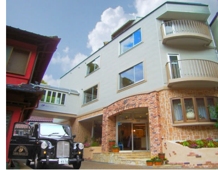
プチホテル ゆばらリゾート