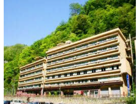
湯原国際観光ホテル 菊之湯